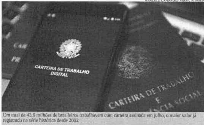
Um total de 43,6 milhões de brasileiros trabalhavam com carteira assinada em julho, o maior valor já registrado na série histórica desde 2002

No mês de julho, todos os grandes grupamentos de atividades econômicas registraram saldos positivos. O saldo de 56.303 postos formais de trabalho no setor de serviço foi maior nas áreas de Informação, comunicação e atividades financeiras, imobiliárias, profissionais e administrativas (27.218 postos), alojamento e alimentação (9.432 postos) e transporte, armazenagem e correio (8.904 empregos) no mês. No Comércio, o destaque foi o setor varejista de produtos farmacêuticos (+3.554) e mercadorias em geral, com predominância de produtos alimentícios – supermercados (+2.419) e minimercados (+1.704). A Construção Civil teve