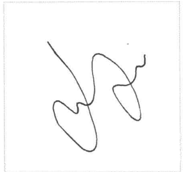
Assinatura de LINDOMARIO MACHADO DE AMORIM

ZapSign Token: 429c6046-****-****-****-c4943b624ad2